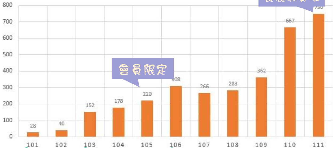
歷年參加教師人數