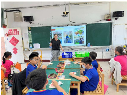
照片 3 DIY 艾草香包