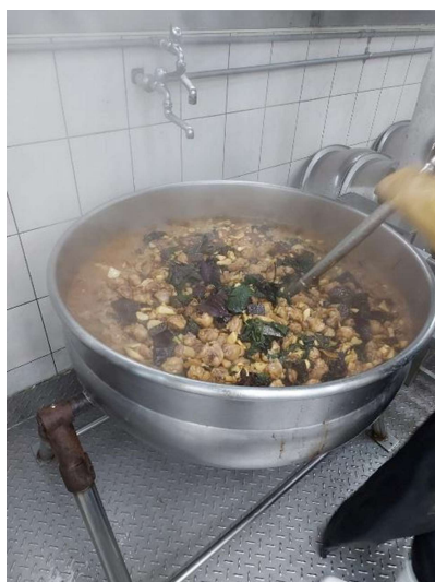
照片 7 校園新鮮紫蘇入菜