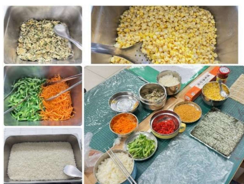
照片 5 DIY 艾草飯捲