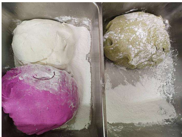
照片 9 DIY 藥草三色丸子