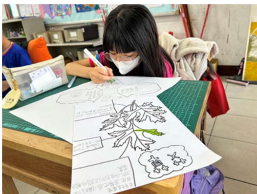
【艾草小達人】學習單作品