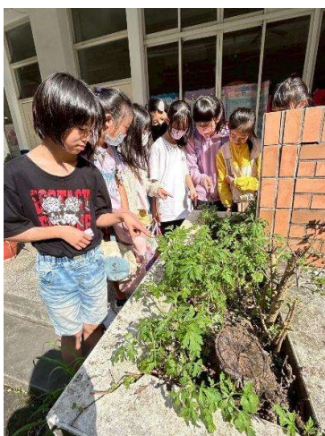
照片 1 觀察並記錄藥草植物