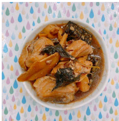
照片 8 紫蘇嫩雞