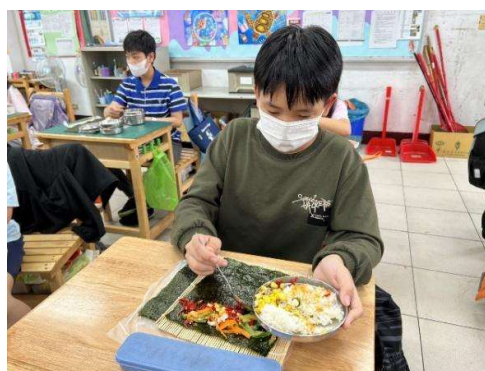
照片 6 艾草飯捲