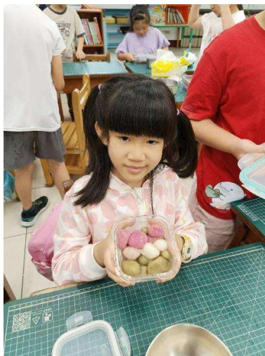
照片 10 藥草三色丸子