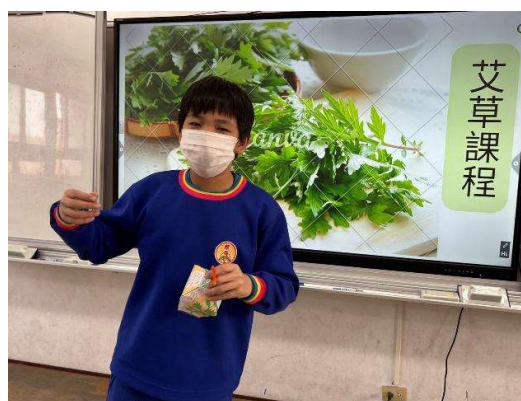
照片 2 選定艾草做為課程內容