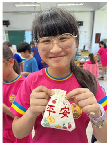
照片 4 艾草香包