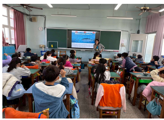
照片 2 說明-永續漁業