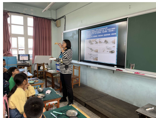
照片 4 說明- 挑刺小達人教學