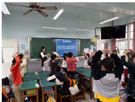
照片 3 說明-學習單前測