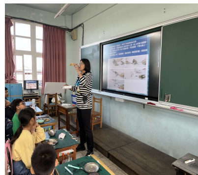
照片 2 說明-聰明吃魚方法