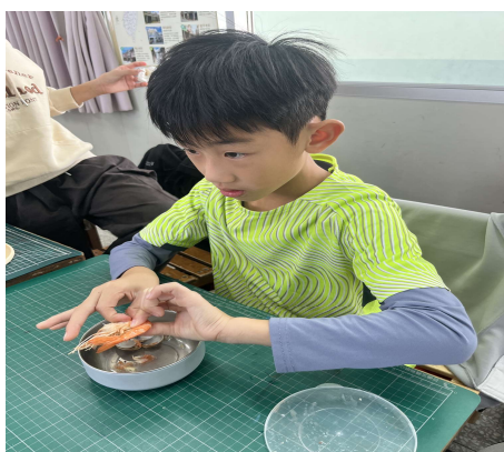
照片 3 說明-品嚐美味國產鮮魚及海鮮