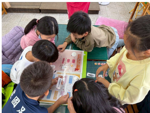
照片 2 說明- 如何分辨魷魚、花枝、透抽