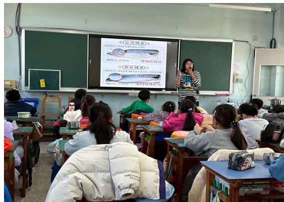
照片 1 說明-認識國產魚