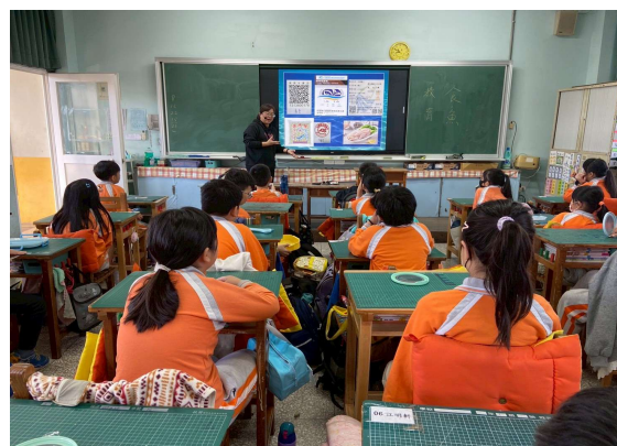
照片 4 說明-認識國產標章