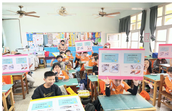
照片 3 說明- 如何選新鮮的魚