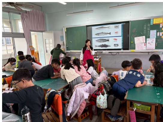
照片 1 說明- 認識國產水產